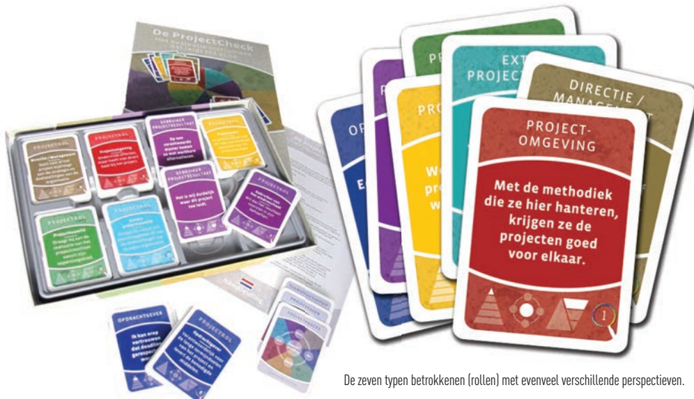
De zeven typen betrokkenen (rollen) met evenveel verschillende perspectieven.

De reikwijdte van de evaluatie draagt veel bij aan de effectiviteit. Standaard staan twee onderwerpen op de agenda: Wat ging goed? en: Wat kan of moet beter? Voor de verbetering van dat laatste ligt het voor de hand antwoorden te zoeken in de samenwerking binnen het eigen team of in de wijze waarop de projectmanagementmethode is toegepast. Dit zijn namelijk factoren die zelf te beïnvloeden zijn, en zo kom je niet – of in elk geval minder – te zitten met het gevoel dat 'er toch niets met de conclusies wordt gedaan'. Je beperken tot deze twee vragen vergroot echter de kans dat in een volgend project dezelfde fouten worden gemaakt. Er zijn, behalve de samenwerking binnen het projectteam, meer factoren die het projectverloop beïnvloeden. Denk daarbij aan het krachtenveld rond het project, de keuze van het project en het projectmanagementklimaat. Zij zijn wellicht lastiger te beïnvloeden dan de teamsamenwerking, maar het zijn wel dé factoren die bepalen of ook in nieuwe projecten de lering uit eerder gemaakte fouten wordt toegepast.